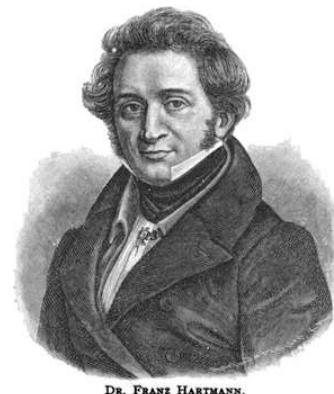
DR. FRANZ HARTMANN.